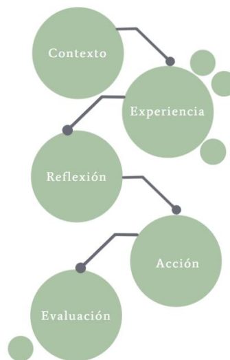
Ilustración 1 Trayectoria FASU basada en el Paradigma Pedagógico Ignaciano (DFAS, 2020)

La Trayectoria de Formación y Acción Social Universitaria (FASU) busca favorecer el trabajo en red desde las diferentes áreas de la Universidad, para lograr sinergias que puedan ser aprovechadas por el estudiantado en su formación para una ciudadanía activa y crítica, que se compromete con su entorno de manera compleja y solidaria.